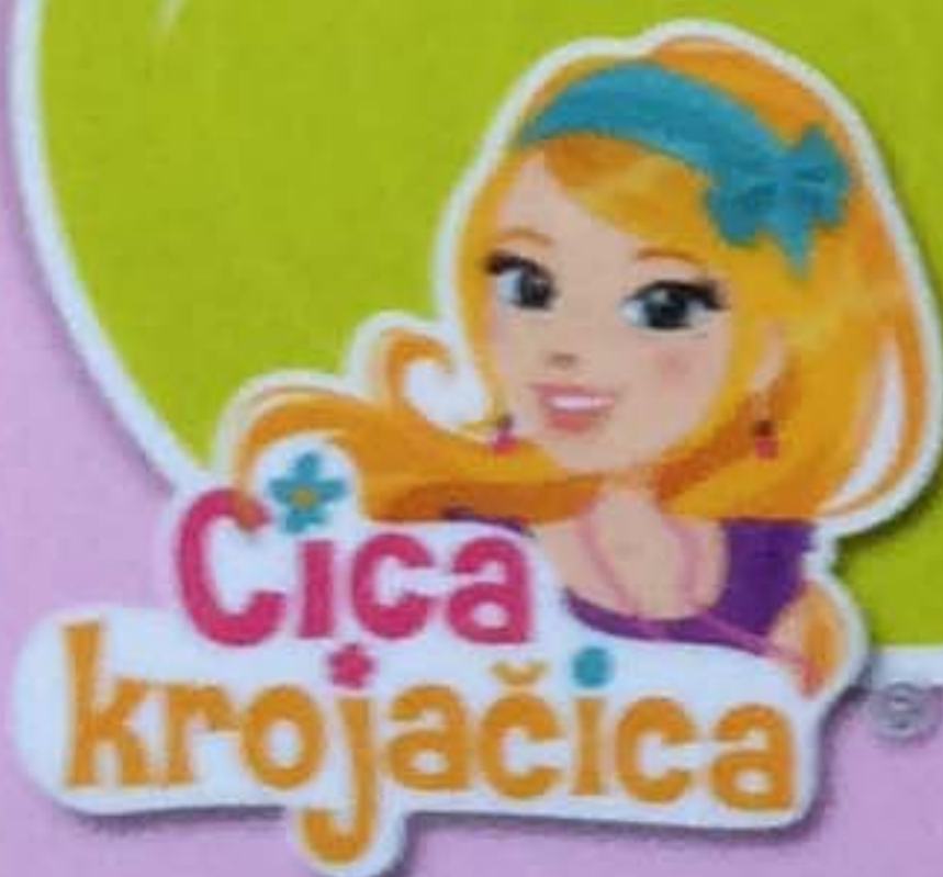
Table s materijalima koji će te inspirisati

Strane s crtežima koje ćeš dovršiti i obojiti i mustre za krojenje