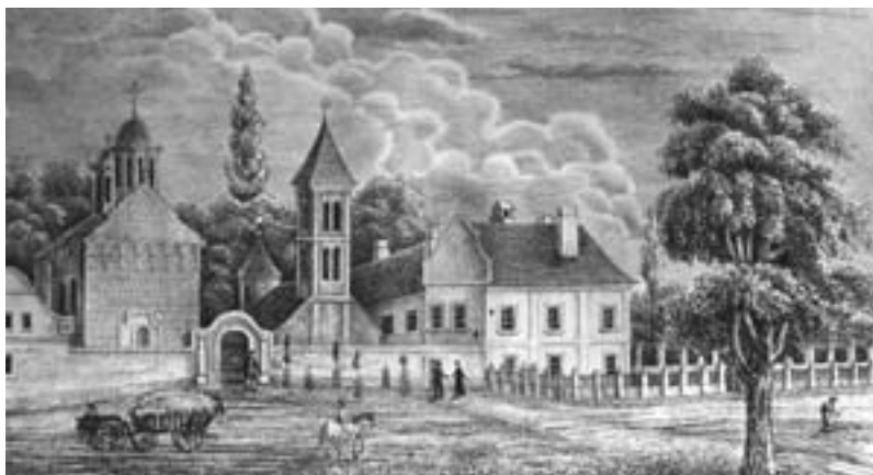
Манасїир Ковиљ. Лиїиографїја Михаела Троха из 1837–1841.