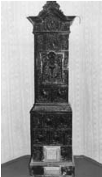
Ковиљчани верују да ова пећ појиче из куће Лазних родитеља

у којој ништа није било Лазино, нити је тамо сачувано. Можда је то једино повећа тамнобраон каљева пећ, за коју се једино мисли да је остала и да је аутентична. Хроничару остаје да замишља да је управо она грејала Лазу дечака, у књизи крштења заведеног под бројем 13, цифром коју Костић никада није волео и од које је целог живота зазирао. Све остало је преобликовано до те мере да од свега није остао камен на камену.