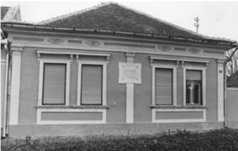
Кућа њодигнућа на њемељу родног Лазиног дома

Са широких дворишних врата, црква и данас готово улази у бившу Лазину кућу, садашњи парохијални дом,