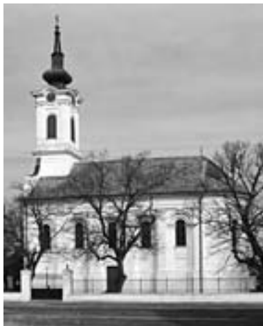
Црква Вазнесења Госїодњег (Горњоковиљска) иодиђнутиа између 1824. и 1829.

Касније, у Црној Гори, пишући 1885. о свом узору и претечи Гетеу, Костић ће записати: „Родио сам се у селу Ковиљу, поред манастира Ковиља... 1841. године, на Три Јерарха, у поноћи... Гете је, као што сам прича, угледао свет 28. августа, у подне, кад је куцкало дванаест у Франкфурту, 1749. Он усред жарког лета, ја у сред љуте зиме; он у по бијела дана, ја у по црне ноћи. Он у првоме погледу, обасут најобилатијом свјетлошћу полудневног сунца, најврелијих љетних дана, те му је можда и зато било све тако јасно што је у његово вријеме било јасно свјетској науци, и неколико још јасније. Геније полуднева није се могао задовољи-