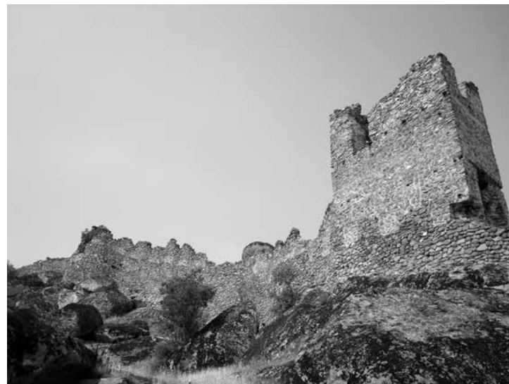
Зидине средњовековног Прилепа

Марков живот започео је у доба када је Србија крупним корацима ширила своје границе и видике. У време његовог рођења млади краљ Душан је управо учврстио власт и спремао се за велика освајања, а породица Мрњавчевић је спадала међу властелу која је била