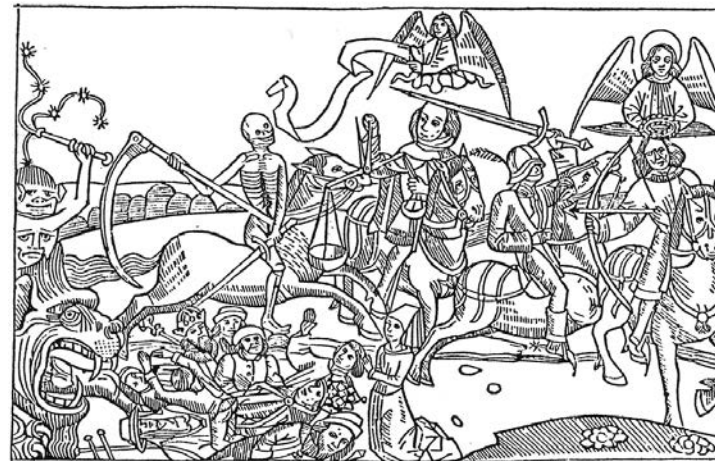
ЧЕТИРИ ЈАХАЧА АПОКАЛИПСЕ

Наредна велика несрећа која је погодила Европу у првој половини 14. века био је почетак Стогодишњег