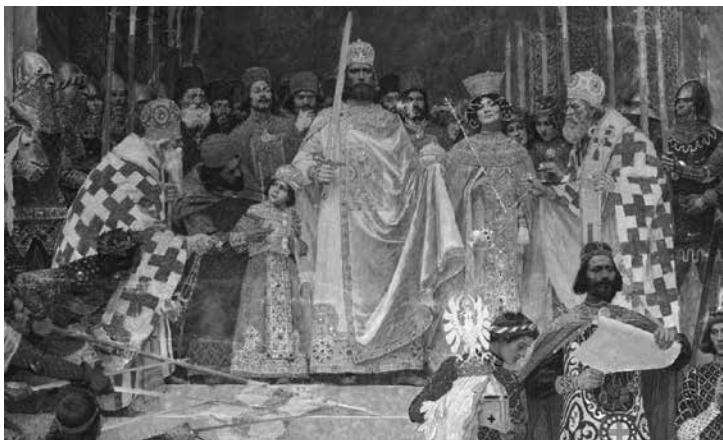
Паја Јовановић, Крунисање цара Душана , Народни музеј у Београду

У предвечерје великих војних похода, који тек што нису отпочели, браћа Мрњавчевићи припадали су оној групи Душанове властеле која није носила звучне титуле, али је представљала ударну снагу његових ратних подухвата. Оно што их је ипак издвајало од другог нижег племства било је то што су стекли поверење неких од најмоћнијих људи на краљевом двору.