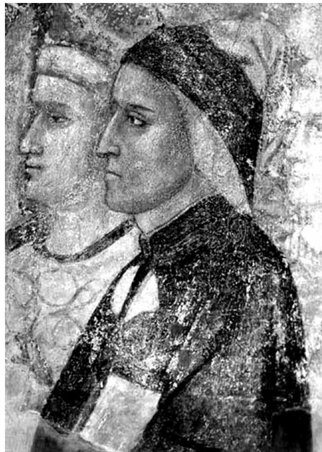
ПОРТРЕТ ДАНТЕА АЛИГИЈЕРИЈА

друштва. Док је у архитектури готика доживљавала свој процват, у Италији и другде почели су да се јављају и први весници једног сасвим новог духа. Почетком 14. века Дантеова Божанствена комедија најавила је важне промене, али ће проћи још доста времена до периода када ће личности попут песника Петрарке, књижевника