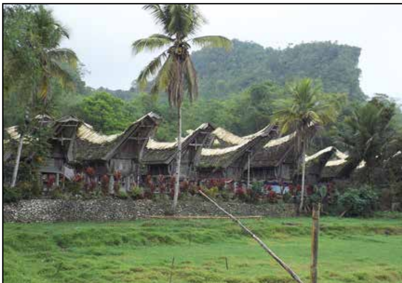
Sulavezi, selo Kete Kesu i tipična Toradža arhitektura