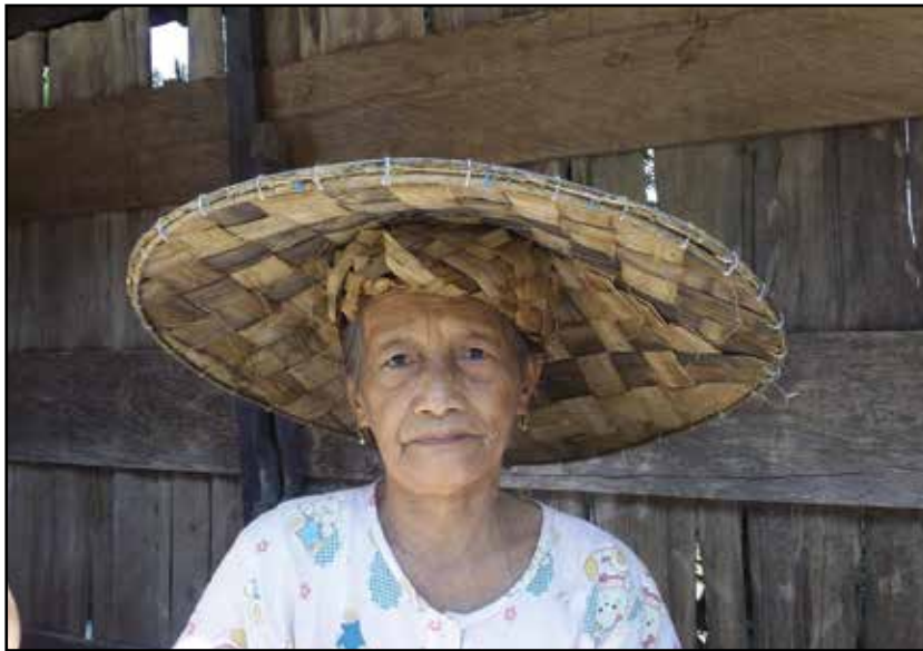
Kalimantan, žiteljka dajačkog sela