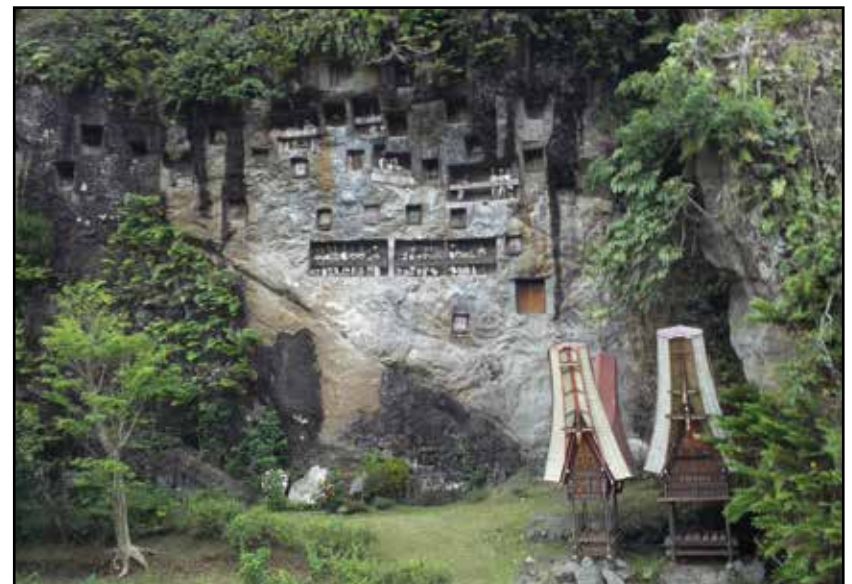
Sulavezi, Tana Toradža – grobovi u liticama i tau-tau lutke