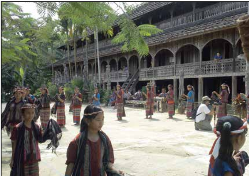
Kalimantan, dugačka kuća i folklor u dajačkom selu