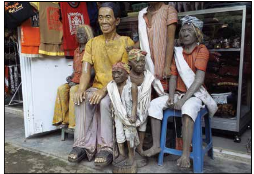
Sulavezi, Tana Toradža – tau-tau lutke