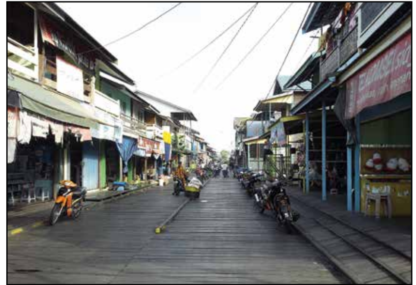
Kalimantan, selo Muara Muntai