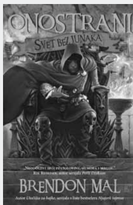
SVET BEZ JUNAKA