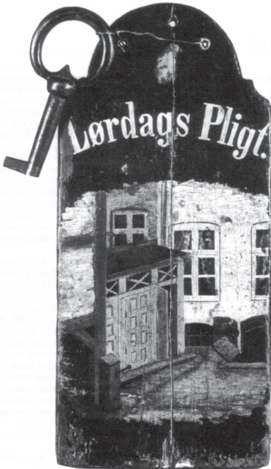
Ključ za nužnik u zgradi (iz Ulice Grenegade, Kopenhagen). Dansk Folkemuseums Billedsamling