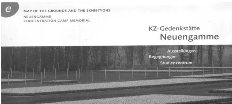
Слика 3. Проспект Меморијалног центра Нојенгаме