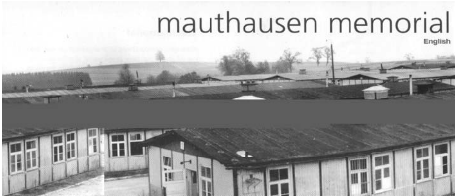
Слика 1. Проспект Меморијалног центра Маутхаузен

Морис Албвак, један од најцењенијих филозофа колективног сећања, истиче споменике и места сећања као најутицајније и најважније за формирање колективног сећања и идентитета у модерном свету. 6