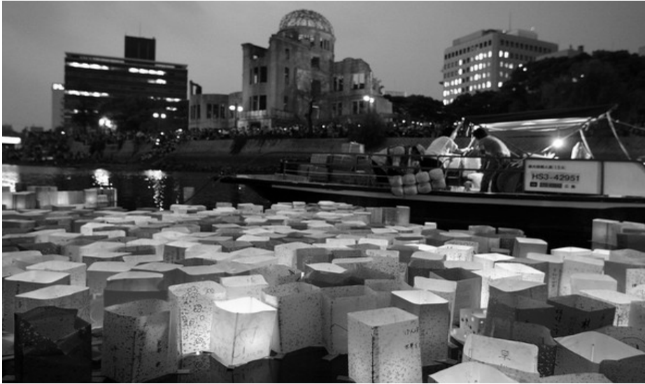
Слика 4. Август 2008, 65 година од бацања прве атомске бомбе. Меморијални простор у Хирошими (Јапан) 44

Неки музеји су посвећени некој одређеној теми (рецимо рату, природи, науци...) а постоје и музеји који обухватају више одељака који се баве разним темама. Такви музеји садрже широк спектар предмета укључујући и документа, употребне предмете разне врсте, уметничке и археолошке. Најједноставнија врста историјског музеја је историјска кућа. Историјска кућа може бити зграда од посебног значаја за друштво, споменик неког истакнутог члана друштва или кућа у којој је живела значајна личност која је битна за друштво које их се сећа.