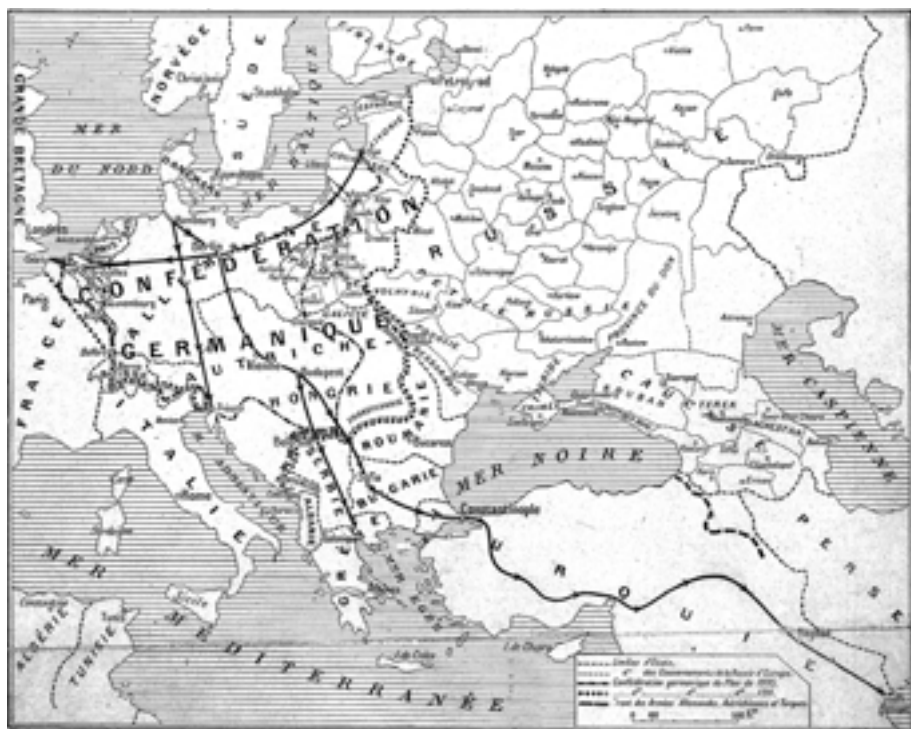
Карта из 1911. приказује делове Европе које Немачка и Аустроугарска планирају да анектирају и њихова даља освајачка стремења. Посебно је истакнута „Бајадска железница“ жила-куцавица немачкој продора на исток (L'ILLUSTRATION, 21. август 1915)