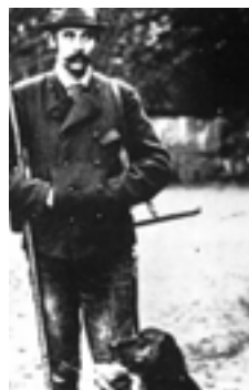
Франц Фердинанд био је страсивени ловац