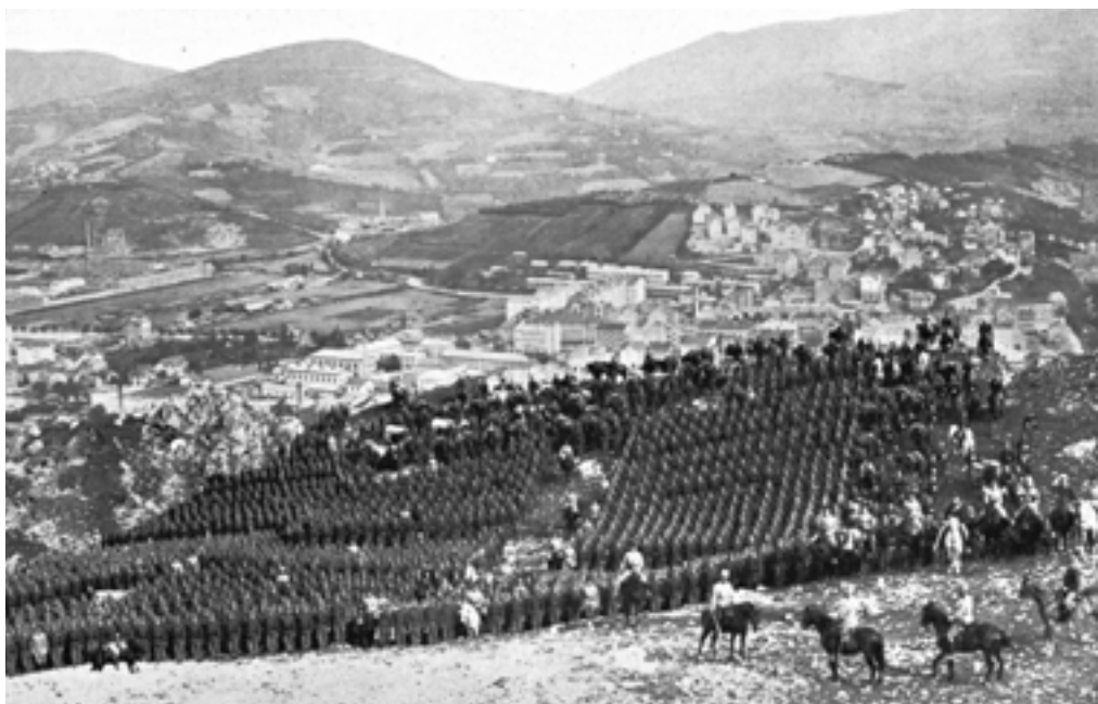
Аустроугарске џрује на маневрима код Сарајева јуна 1914.