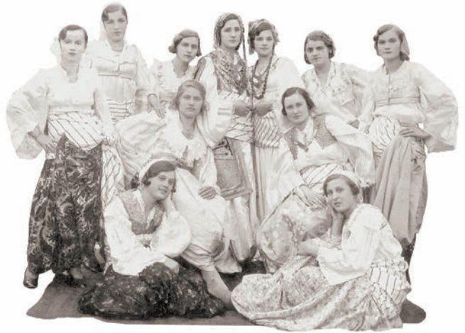
Дворење младе пред удају, почетак XX века

Веран друже не веруј девојке, данас вера у девојке нема. Трипут ме је једна преварила. „Данас-сутра оћу поћ за тебе.“ Прекосутра оде за другога, за другога, за другара мога. Другар мене у сватове зове, да му будем девер до девојке. Да л' да идем, да ли да не идем? Да ја идем, срамота ће бити. Да не идем, жао ће ми бити, што је мене болна преварила.