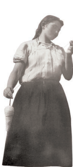
Девојка преља из Херцеговине