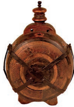
Чутура из Војводине, XIX век

Вино пије Дојчин Петар, варадински бан; попио је триста дукат' све за један дан и још к томе врана коња, златан буздован. Карао га краљ Матијаш, земљи господар: „Бог т' убио, Дојчин-Петре, варадински бан'! Буд ти попи триста дукат' све за један дан, зашто попи врана коња, златан буздован?“ Ал' беседи Дојчин-Петар, варадински бан: „Не карај ме, краљ-Матијаш, земљи господар'! Да си био ти у крчми где сам пио ја, и љубио крчмарицу којуно сам ја, попио би равну Пешту и сав Будим град!“