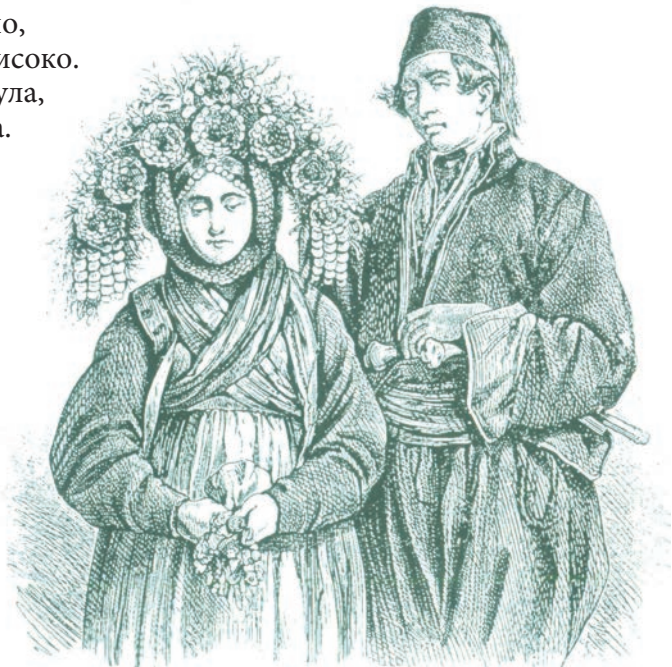
Феликс Каниц, Српски сеоски младенци

◆ Сунце је симбол живота, топлине, дана, светлости, ауторитета, као и симбол небеског пространства. У народним песмама сунце је велики изазов девојкама због снаге и лепоте.