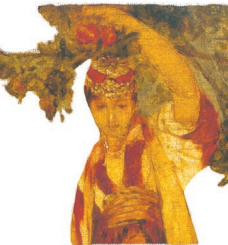
Ђорђе Крстић, Под јабуком (деталј)

♦ Јабука се даје као дар или као доказ милости, пријатељства и љубави. Значајну улогу има у односима момка и девојке, приликом просидбе и свадбе.