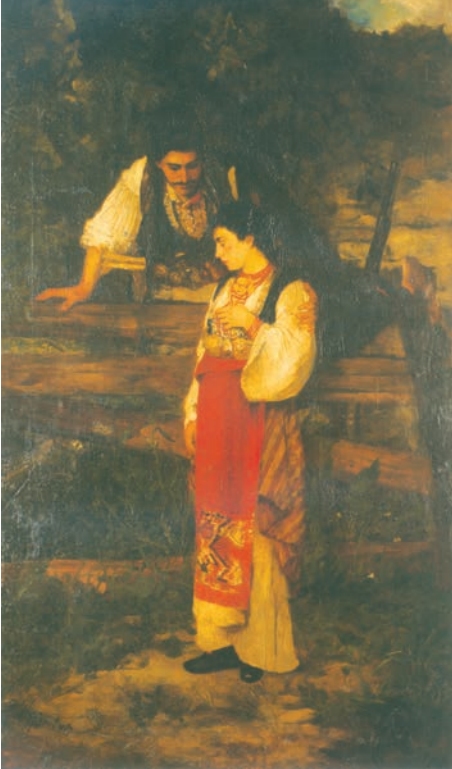
Ђорђе Крстић, Растанак момка и девојке

♦ Винова лоза је сеновито и свето растиње за које се верује да штити од демона. Употребљава се у бајању против урока, као средство за бољи раст косе и одржавање трудноће.