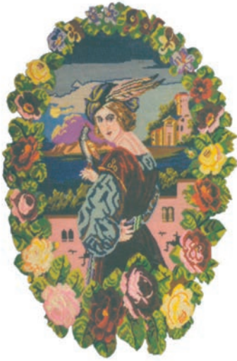
Младић са соколом, детаљ с пиротског Ђилима

♦ Соко је знак племићког достојанства. Због храбрости, оштрог вида и брзине лета коришћен је у прошлости у лову и ратним походима. Као што је соко спретан на небу, тако је и видра у води позната по окретности и снажљивости.