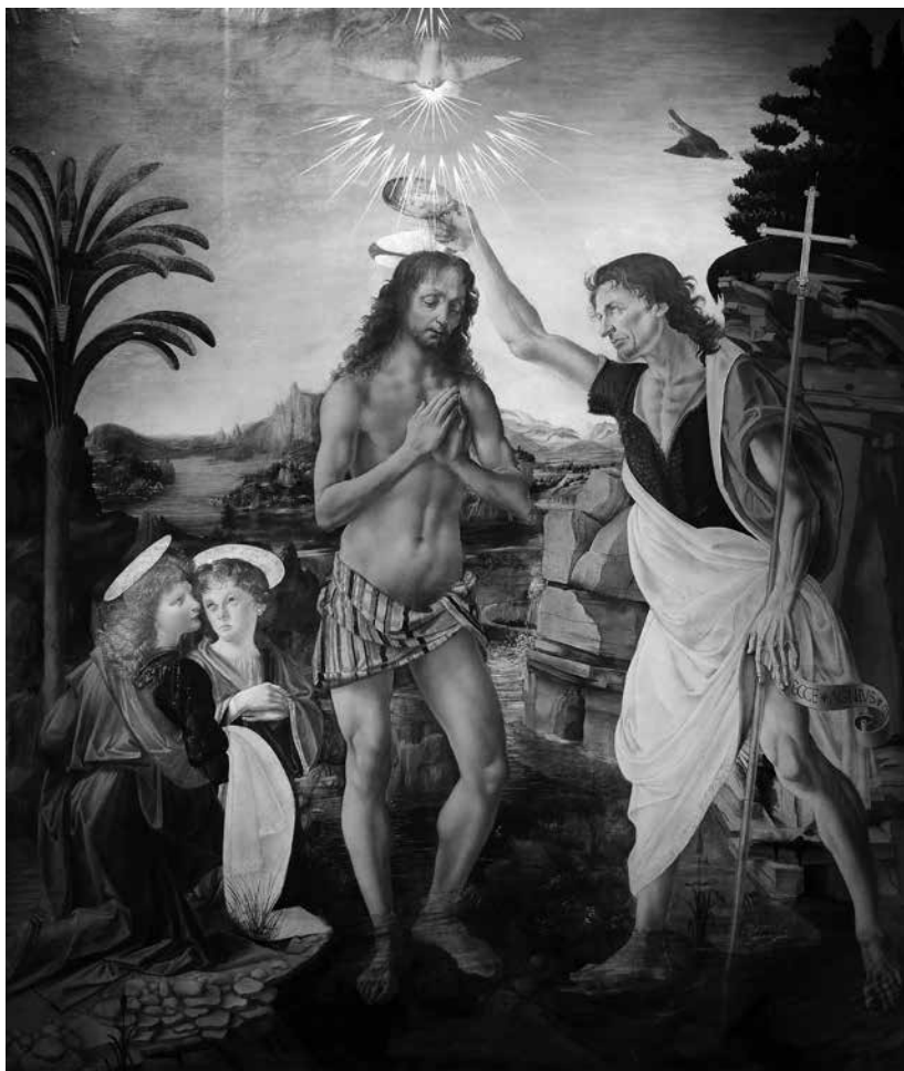
Slika 1. Krštenje Hristovo (Verokio i Leonardo)