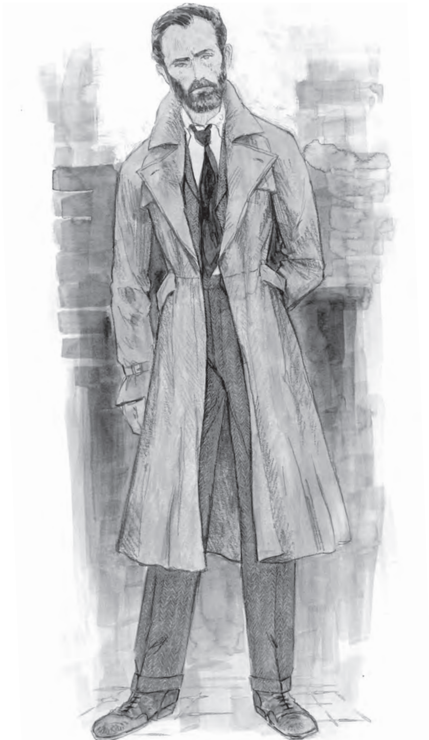
(gore) SKICA ZA KOSTIM ALBUSA DAMBLDORA (na suprotnoj strani) DOSIJE ALBUSA DAMBLDORA S PRAZNI PROSTOROM ZA UBACIVANJE POKRETNIH FOTOGRAFIJA