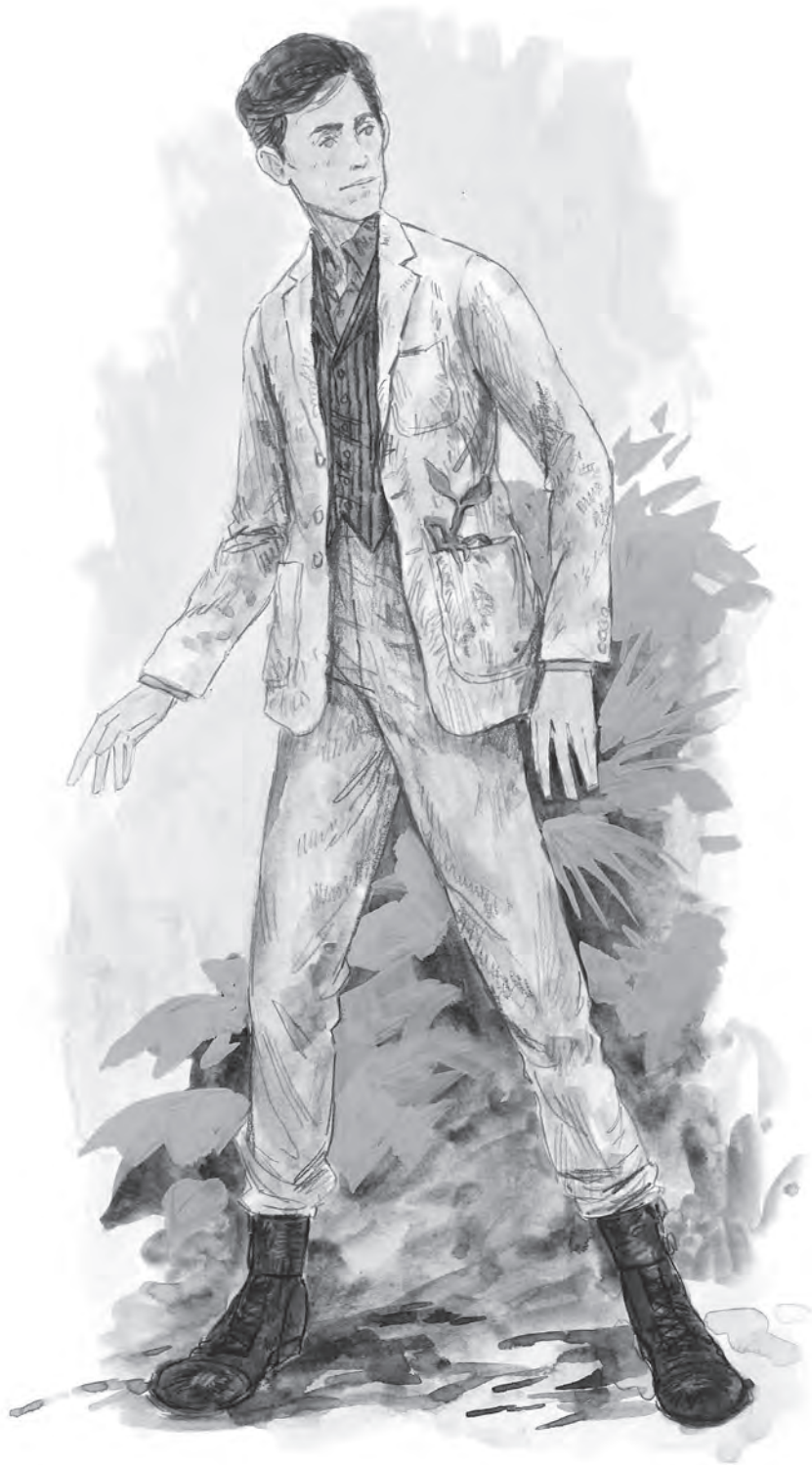
SKICA ZA KOSTIM SALAMANDERA SKAMANDERA