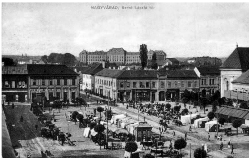
Нађварад (Велики Варагин, данас Орадеа у Румунији)

Nagyvarad [Нађварад – данас Орадеа, град у Румунији на граници са Мађарском]