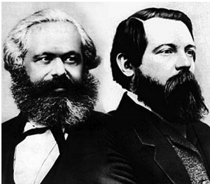
Карл Маркс и Фридрих Енџелс

– Славосерби су сужањска пасмина, скот гњуснији од икојега другога. Узмимо у човеку три ступња савершенства: ступањ животиње, ступањ разбора, и ступањ ума, душевности. Славосерби нису подпуно достигнули ни најнижи ступањ, а из њега не могу се дигнути. Они немају свест, ...не могу мучат, ни лајат, мироват ни скакат, него се у свему владају како им њихови пастири одређују – Анте Старчевић, хрватски националиста у свом делу Писма Мајјарољцах .