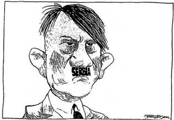
Рујање Слободану Милошевићу у Француској