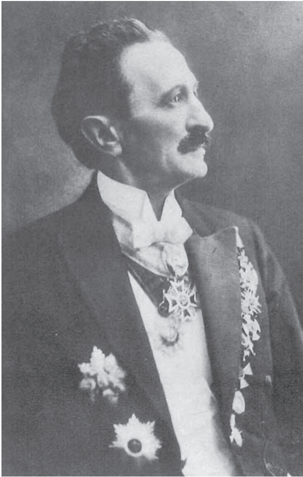
Бранислав Нушић у свечаном оделу са одликовањима

Али то га је одобровољило, па је младом комедиографу и песнику обећао службу. Ускоро је постављен за писара српског конзулата у Приштини.