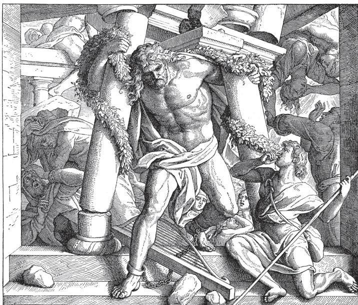
JULIJUS ŠNOR FON KAROLSFELD: SAMSON RUŠI HRAM FILISTEJACA

Povest o Samsonu i Dalili jedno je od najpoznatijih i u umetnosti najviše korišćenih starozavetnih predanja, da ovde pomenemo samo Miltonov spev, Hendlov oratorijum i operu Kamija Sen Sansa, ili filmsku sagu Sesila de Mila. Samson je bio sudija, jedan od poslednjih pre no što će Izrailj od teokratske države postati carstvo, a to znači da bi trebalo da je živio oko 1000. godine pre naše ere. Iako bi se po imenu reklo da potiče od nekog bića iz prastarog kulta Sunca, u biblijskoj legendi koja se oko njega stvorila Samson je prikazan