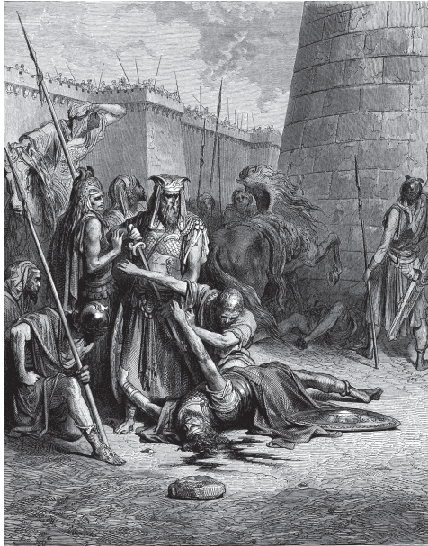
GUSTAV DORE: AVIMELEHOVA SMRT (1866)

Jedan period istorije Izrailja u Starom zavetu se zove Doba sudija. Hronološki, to je otprilike razdoblje između 1200. i 1000. godine pre n. e., a sudije su bile vođe pojedinih plemena, s tim što se za njih kaže da su bile „uticajne ličnosti, bez konkretnog državnog aparata, koje na osnovu ličnog autoriteta preuzimaju ulogu savetnika i pravnog posrednika“, ali je njihova vlast i u drugim područjima života bila praktično apsolutna. Sudija je bilo dvanaest – šest velikih i šest malih. Jedan od njih zvao se Avimeleh. Otac Avimelehov